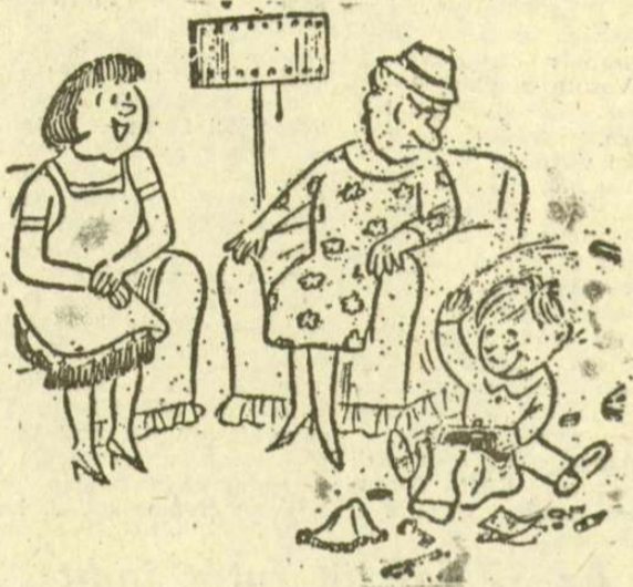
(A Polische Rundschau karikatúrája)

Tudod, a mi gyerekeink mindenre kíváncsiak.