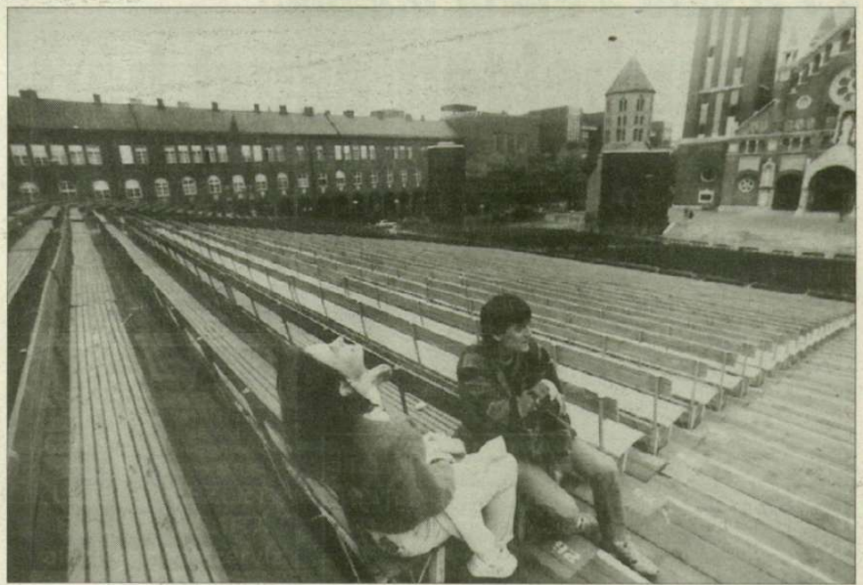
A menesztett nézőtér.

Mi sem természetesebb, hogy amikor a szerződéskötés