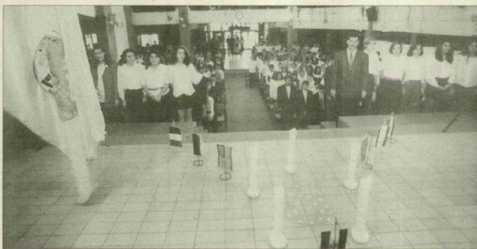
Öt gyertya a Deák-gimnázium születésnapján

A Deák Ferenc Gimnáziumban pénteken, a névadás évfordulóján ünnepelték az iskola ötödik születésnapját. Öt évvel ezelőtt ezen a napon az angol-magyar kéttannyelvű oktatás megkezdése tiszteletére az ünnepség díszvendégeként Mark Palmer, az Egyesült Államok akkori nagykövete jött Szegedre, mintegy megerősítésként annak, hogy a gimnázium egykor, az angol nyelv és kultúra oktatása területén tartalmas kapcsolatot alakít majd ki amerikai testvériskolájával, a Massachusetts állambeli Brook Schoolal. Az amerikai kapcsolat az idei ünnepségen sem maradt jelzés nélkül. Az iskola diákjai, tanárai és a megemlékezés ven-