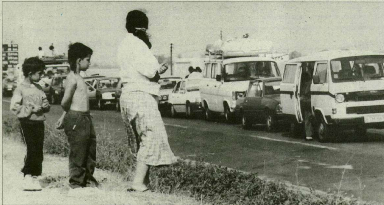
A várakozás szombat este volt a leghosszabb, meghaladta a 10 órát

■ Tavaly ősszel látogatást tett keleti határszakaszunkon az azóta már exminiszter lett Schamschula György, aki akkor egy nagyszabású, milliókat felemésztő építkezés vázlatait mutatta be a szakembereknek, illetve a sajtó képviselőinek. A tervet az úgynevezett halszálka elrendezésű kamionparkoló megépítését irányozta elő, amelynek üzembe helyezése nagymértékben gyorsíthatná a forgalmat. Az elkép-